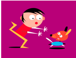
Obéir = to obey